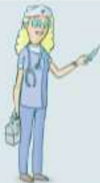
DER KRANKEN ___ EGER