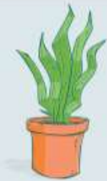
DIE ___ ANZE