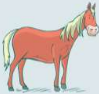
DAS ___ ERD