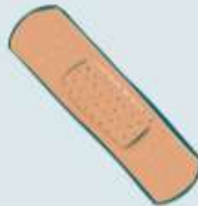
DAS ___ ASTER