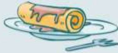
DER ___ ANNKUCHEN